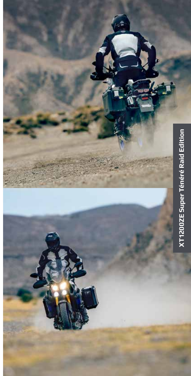
XT1200ZE Super Ténéré Raid Edition