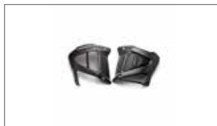
Paneles laterales de carbono