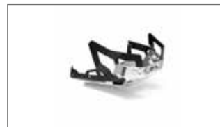
Kit extensor del protector de cárter