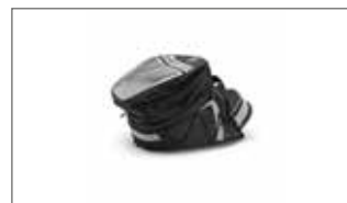
Bolsa de depósito