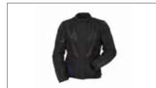
Chaqueta Hombre Adventure