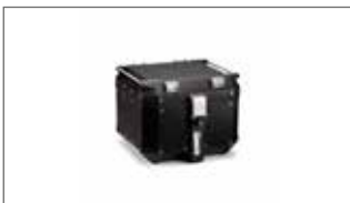
Top Case - Negra