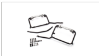
Soportes para maletas laterales