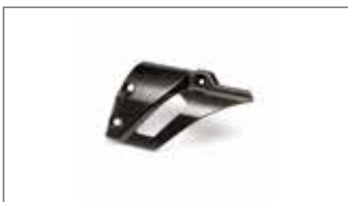
Protector de escape de carbono