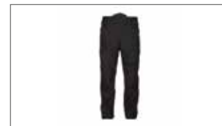
Pantalones Hombre Adventure