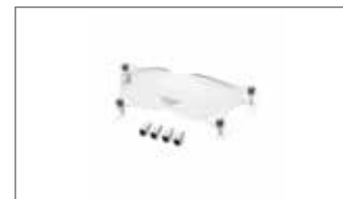
Protector de faro