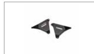
Protectores de bastidor de carbono