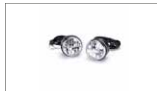
Kit de faros antiniebla LED (2)