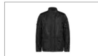
Chaqueta Mujer Adventure