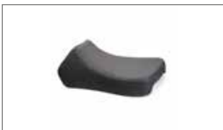
Asiento bajo Super - Black