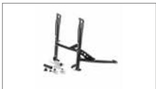
Kit de caballete