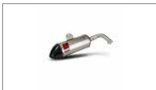
Escape Slip-On de titanio (1)