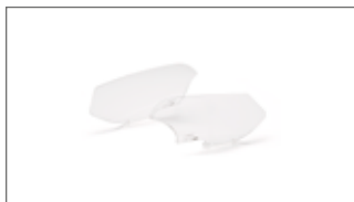
Deflectores de viento