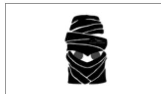
Protector de depósito