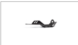
Protector del eje de transmisión