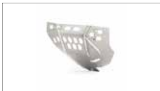
Protector de cárter