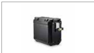
Maleta laterales en aluminio (color negro) - Izquierda