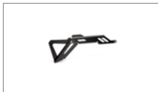
Protector de la pinza del freno trasero