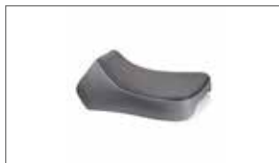
Asiento bajo - Grey