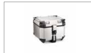
Top Case en aluminio