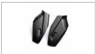
Protectores de horquilla delantera de carbono