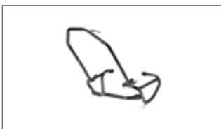
Protector de motor