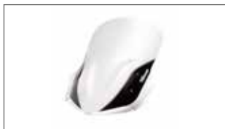
Pantalla alta (2)