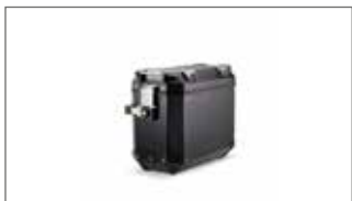
Maleta laterales en aluminio (color negro) - Derecha