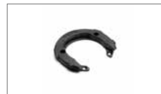
Anillo de fijación bolsa depósito

(1) Los sistemas de escapes Akrapovic no son un producto Yamaha, están completamente desarrollados y producidos por Akrapovic para su uso en circuito cerrado o competición. Si un modelo dispone de catalizador opcional, sólo con el montaje del mismo se cumplirá la homologación.