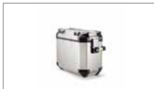
Maletas laterales en aluminio - Izquierda