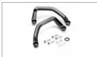
Asideros para pasajero