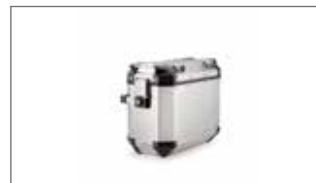
Maletas laterales en aluminio - Derecha